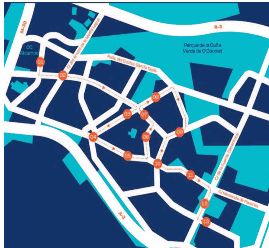
MAPA DEL RECORRIDO

En pocos días vienen los Reyes Magos de Oriente a nuestras casas, dejando Regalos a los que se hayan portado bien y carbón a los que no tanto. Pero antes como de costumbre tendrán que pasearse por las calles de la ciudad, regalando caramelos y haciendo felices a los más pequeños, algo que llevan esperando prácticamente todo el año.