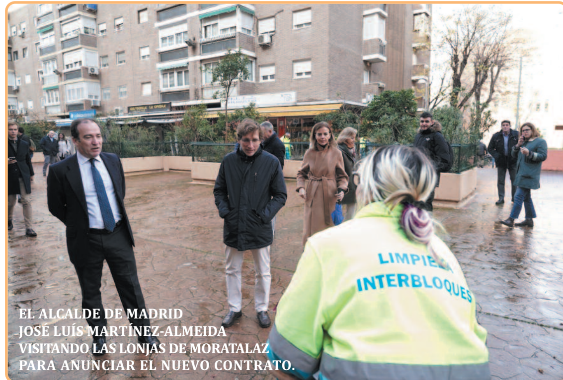
EL ALCALDE DE MADRID JOSE LUÍS MARTÍNEZ-ALMEIDA VISITANDO LAS LONJAS DE MORATALAZ PARA ANUNCIAR EL NUEVO CONTRATO.

Este contrato de servicios de limpieza y conservación, que incluye por primera vez las 325 zonas interbloques de Madrid, cuenta con un gasto plurianual de 51,96 millones de euros para cuatro años y ha sido adjudicado a la UTE Grupo Eulen con Obras y Servicios Taga S.A. Incluye todas las zonas de esta tipología existentes en Madrid, ubicadas